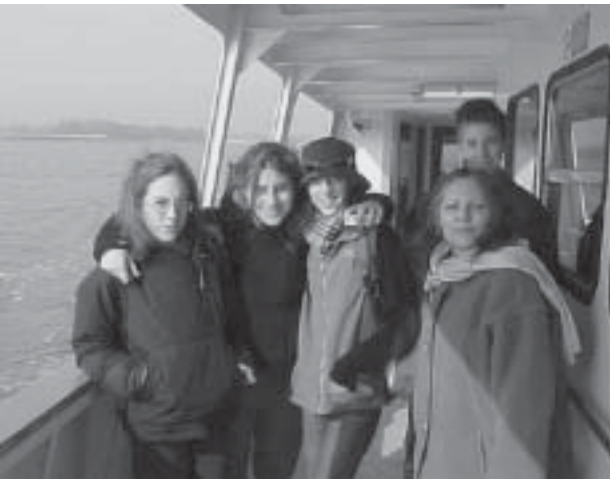
Sotto a sin.: Verso Torcello - Sotto a destra: Torcello, Trono di Attila.