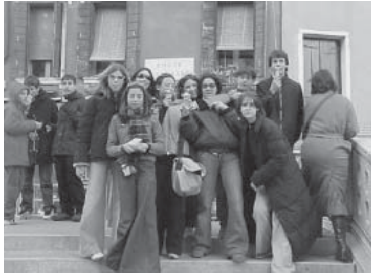
Sopra: Presso la Chiesa dei Frari.

Poco per volta si colonizzarono alcune isole (Murano, Burano...) vicino a Torcello e dopo anche quelle di Venezia; l'au-