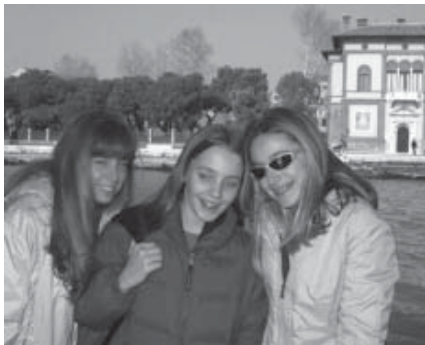
Sopra: Trio della Terza B. - A destra: Turisti per caso.