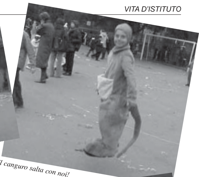
Il canguro salta con noi!