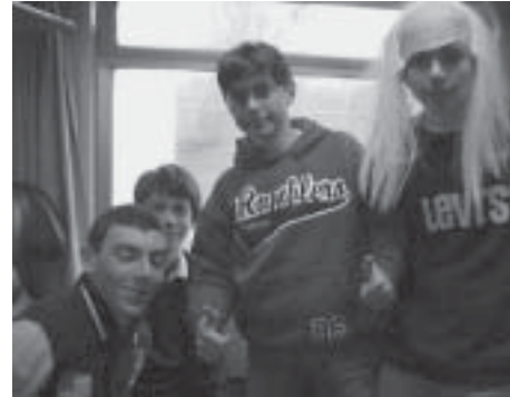
Nelle foto: In treno verso Venezia.