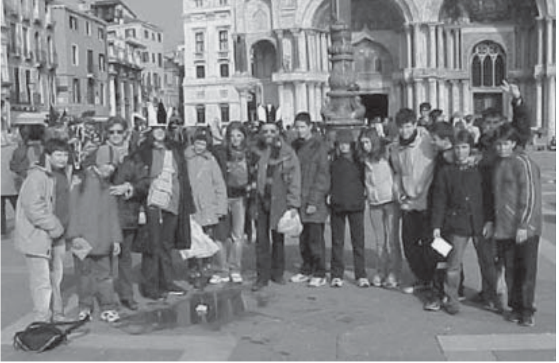
Sopra: In piazza San Marco.