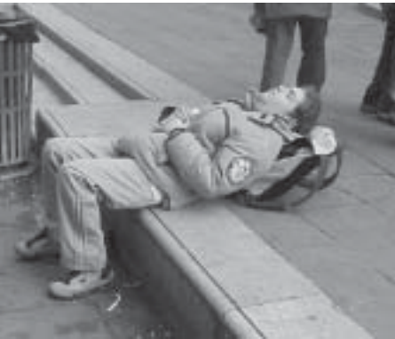
Sotto: Stremato alla meta! (S. Marco)

mento della popolazione determinò la necessità di un posto più grande dove vivere: la vicina Venezia, che stava diventando sempre più importante; per questo motivo Torcello fu smembrata della maggior parte degli edifici per costruire la nuova Torcello (l'odierna Venezia).